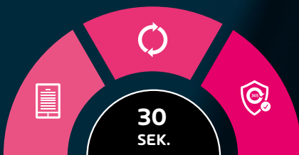
Abb.: Einfacher Onboarding-Prozess in drei Schritten

Mit 365 Total Protection schöpfen Sie das volle Potenzial Ihrer Microsoft Cloud Dienste aus.